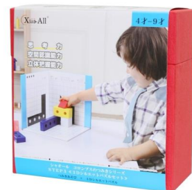
【STEP3 3Dシルエットパズルセット】