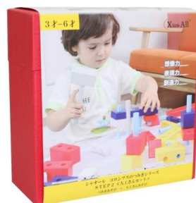
【STEP2 大工さんあそびセット】