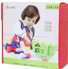
【STEP1 つみき基本セット】